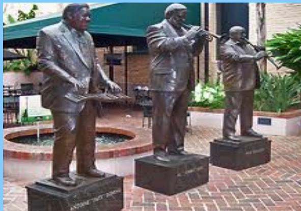
Fats Domino, Al Hirt & Pete Fountain, Musical Legends Park

Seit über 40 Jahren organisieren wir Musikreisen – weltweit!