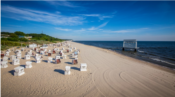
42 KM langer Sandstrand

Diese Reise bietet Ihnen auch viel Zeit, die Insel nach Ihren eigenen Bedürfnissen zu erkunden oder auch nur die Zeit im Strandkorb zu geniessen.